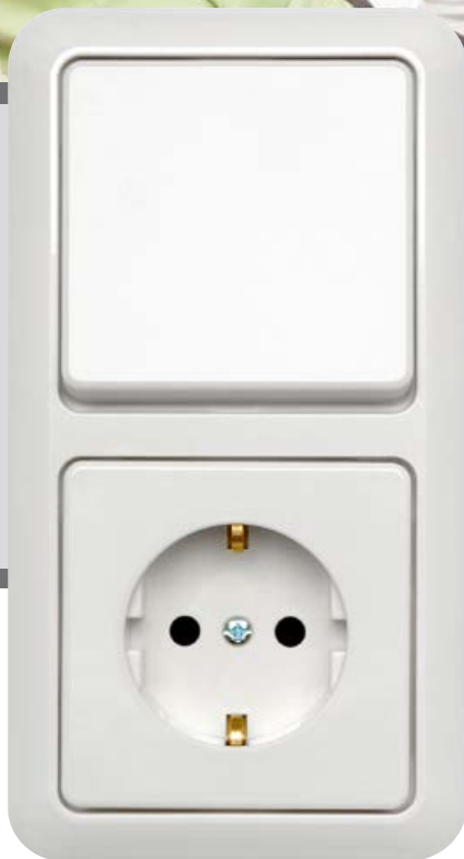
ultraweiß - RAL 9010 ultra white