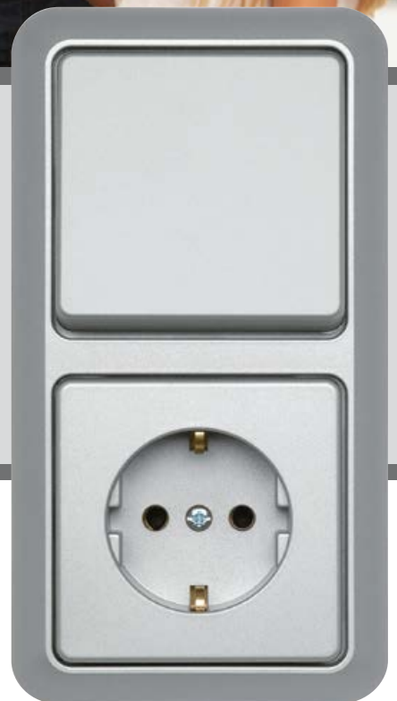
mattsilber mat silver